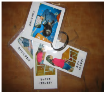
姿勢や片づけの指示