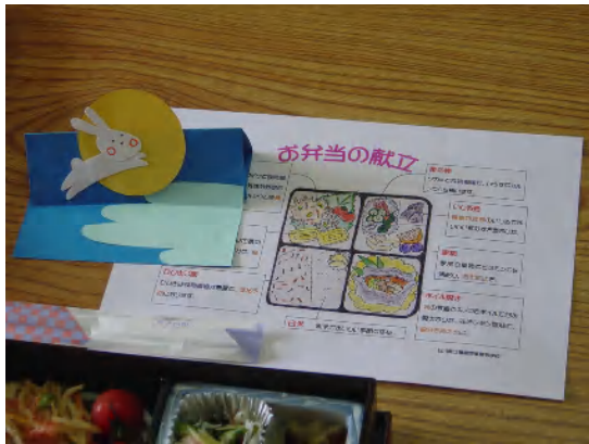
弁当の献立説明のプリントと メッセージカードを弁当に添えた

一人暮らしの高齢者に集ってもらい、食事調査の結果と献立説明、そして手作りのカードを添えて、食べてもらった。