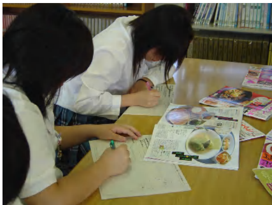
雑誌を参考にメニュー考案