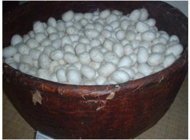
牛首紬の材料「玉繭」