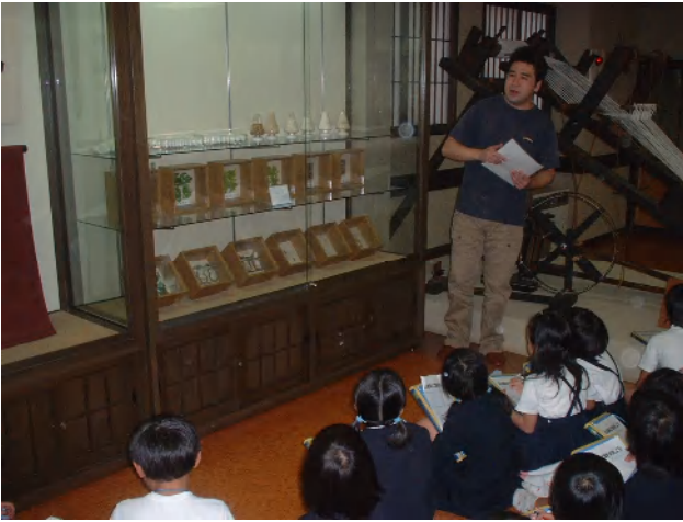
工場長さんから材料についての説明