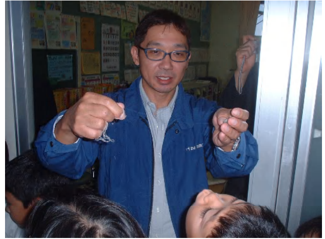
玉繭から引かれたうねりのある糸