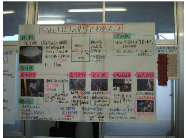
見学で見つけたことの掲示