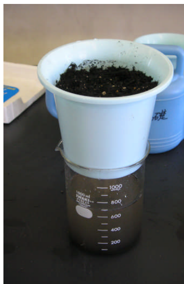
図7 市販土II (腐葉土主体)