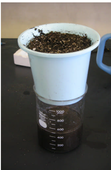
図6 市販土I (ピートモス主体)