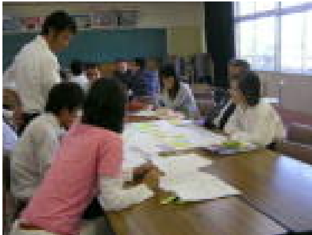
グループに分かれ授業について話し合う様子