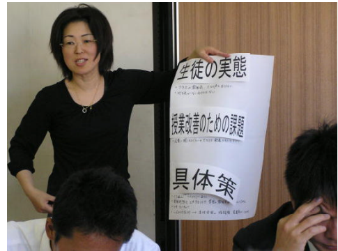
話し合った内容を発表する様子