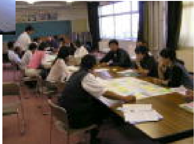
意見をシェーピングし、まとめようとする様子