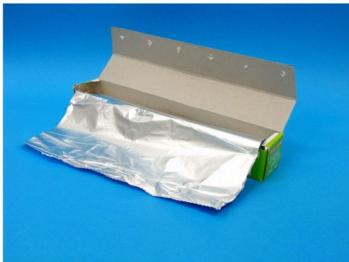
(材料③ アルミホイル)