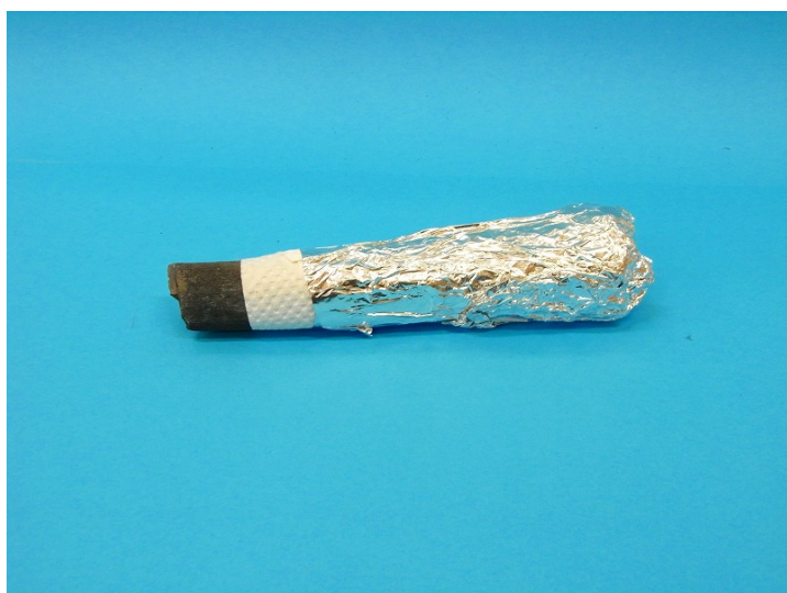
(完成した木炭電池)