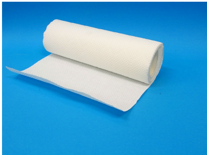
(材料② キッチンペーパー)