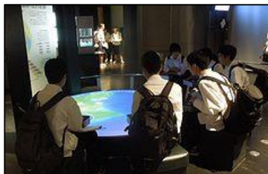
上野国立科学博物館