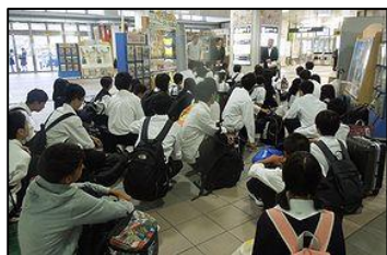
小松駅にて出発式