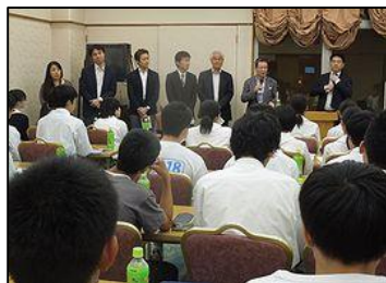
来て下さった同窓生の方々の紹介