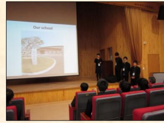
↑韓国の研究発表です。↓