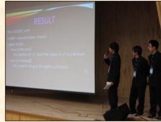
The Solver Decision Method By The Date(日付による解答者決定法)