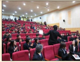
自己紹介中です。 もちろん英語です。