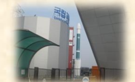
ソウル果川科学館