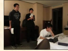
←ホテルで明日の発表練習