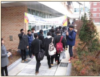
大田科学高校到着 大きな旗で歓迎されました。