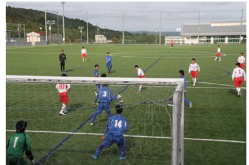
【準優勝サッカー部 試合風景】

時間の制約など辛い事もありますが、先輩達が切りかえや集中、スキマ時間の活用等で克服してきたように、新人大会等で活躍した1年生諸君においても是非『 両立が出来る桜高生 』として、今後とも充実した桜高生活を送って欲しいと思っております。