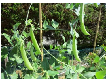
スナップエンドウ