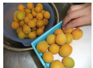
6/27 梅干し作りに挑戦