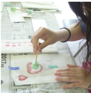
6/14 体験活動「ステンシル」それぞれの好みのデザインのバッグに仕上げました♪