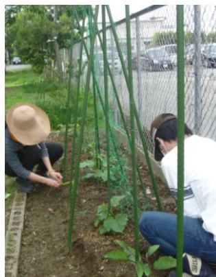
6/14 菜園にネットを張りました