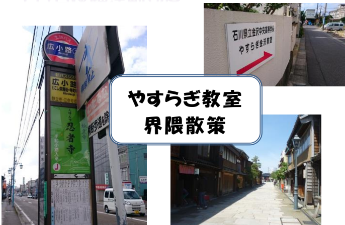
やすらぎ教室 界限散策