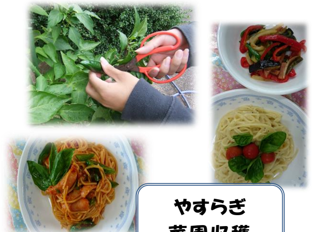
やすらぎ 菜園収穫