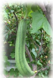
大きなヘチマが育ちました