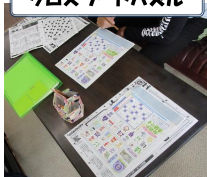
クロスワードパズル