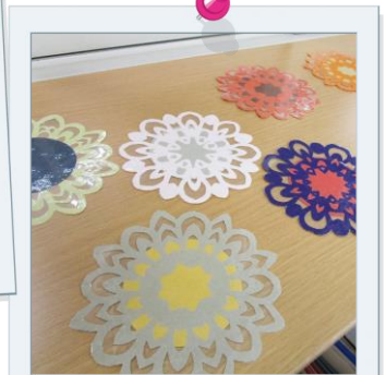
生徒作品:切り絵コースター