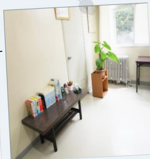
面談室一部リニューアル