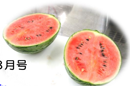
菜園のこだまスイカ

いよいよ夏休みです。やすらぎ教室の菜園では夏野菜が次々に実り、来室した生徒が収穫を手伝ってくれています。野菜の収穫や物づくりなどの活動をする、とても手際が良かったり、細かい作業が得意だったり、また周囲を気遣って行動する優しさを持っていたり…体験活動は生徒の素敵な一面を知ることができる貴重な機会です。