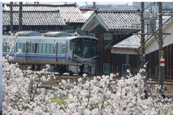
北高グラウンドの横を駆け抜ける北陸線