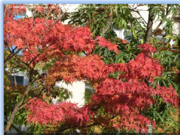
小松北高玄関の紅葉

秋も深まり、木々の紅葉も鮮やかな季節を迎えました。学校は今、一年の後半を迎え、中には心の不安をずっと抱えて欠席気味であったため、進級が不安視される生徒が見られるかもしれません。こういったケースでは今後の見通しを本人と保護者に正しく伝え、今後について十分話し合う必要があるかもしれません。また、過去の一時期不登校となり、現在は普通に学校生活を送っている生徒でも、不安が解消されたと言うよりも、いわゆる「寛解」の状態かもしれません。今までとって「手のかからない良い子」が、突然登校できなくなるケースもよく見られます。深刻なケースに目を奪われがちですが、先生方には、生徒のちょっとした変化にも気を配り、欠席が目立つようになったならば、問題が深刻化する前に