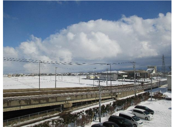
やすらぎ小松教室からの景色

先日の大雪では、あっという間にたくさんの雪が道路や町を被い、通勤や通学など生活に大きな影響が出ました。雪かきで体力が消耗された方も多いのではないのでしょうか。まだまだ雪の降る日は続きそうです。インフルエンザも流行しています。うがいや手洗い、十分な睡眠と栄養で寒さ厳しいこの冬を乗り越えていきましょう。