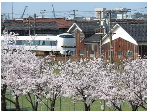
北陸新幹線の工事が近くに迫る

さまざまな悩みを抱える生徒たちに対して、問題が深刻化する前に、遠慮せずやすらぎ教室のSV相談を利用していただければ、解決の糸口が見つかるものと考えます。