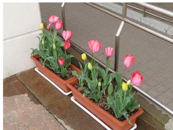
今冬の風雪に耐えて咲く