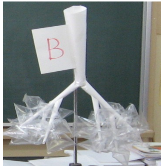
肺のモデルB（肺胞あり）

500mm×500mmのビニル袋2つに空気を入れて、紙を丸めてつくった気管につける。