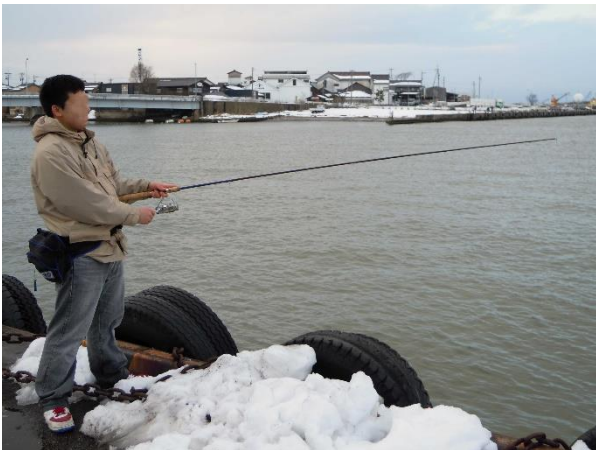
複合材料による釣り竿（課題研究）