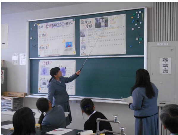
テーマ研究発表会（2年）