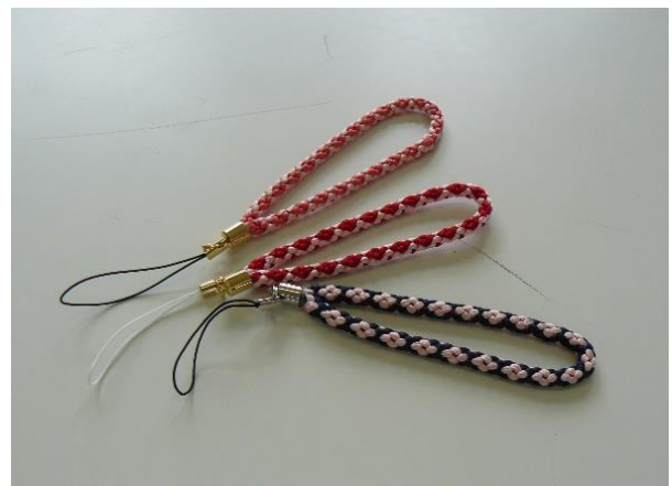
組紐ストラップ（実習）