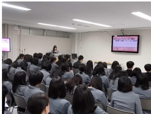
課題研究発表会②（3年）