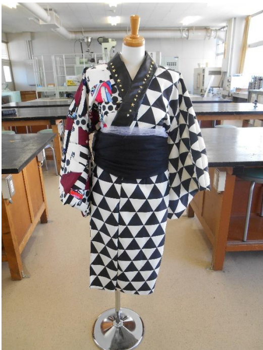
デジタル捺染による着物（課題研究）