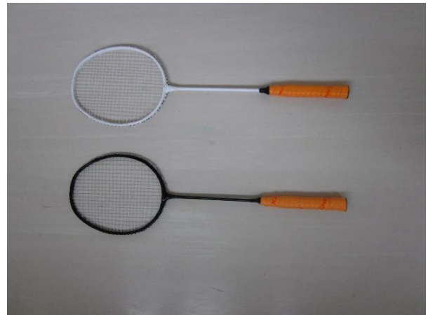
複合材料によるラケット（課題研究）