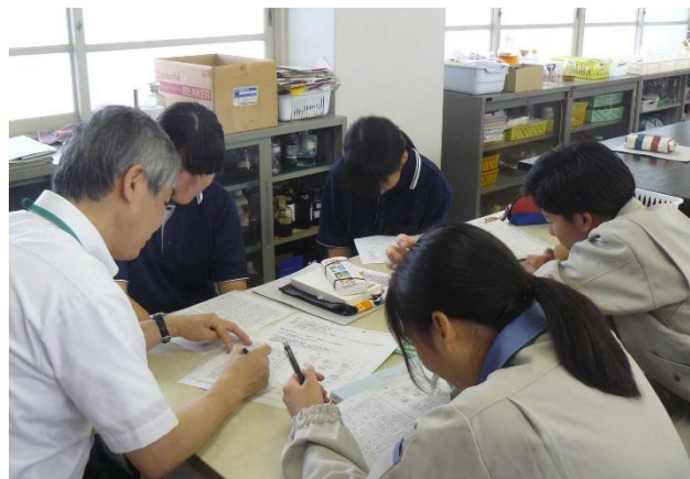
課題研究グループミーティング（3年）