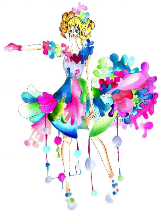
ファッションデザイン画（実習）