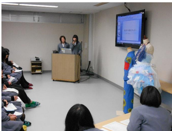
課題研究発表会③（3年）