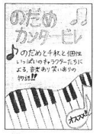
1年 成瀬なつみさんの書籍POP

この番組の特集は大きな反響を呼び書籍化へとつながり、映画化されました。私もこの本を実際に読んだのですが、千恵さんは皆に