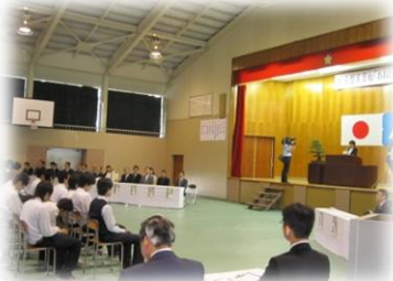
6/8 おおとり丸竣工式