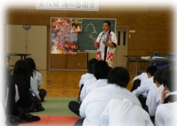
6/20 いやさか太鼓講演