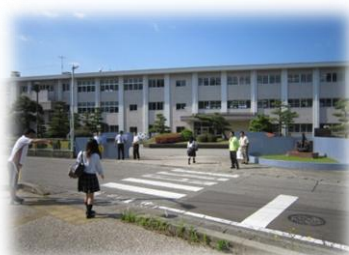
6/22 自転車マナー指導