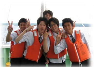
6/14 おおとり丸乗船（1年）