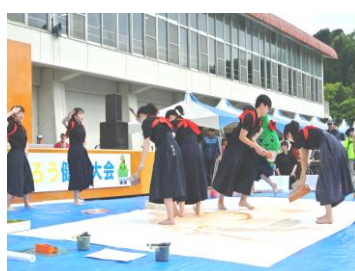
周囲を魅了した書道パフォーマンスのメンバー