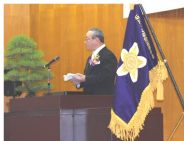
心温まる学校長からの式辞

3月3日(火)、能登高校の第9回卒業証書授与式が本校第一体育館で挙行されました。今年度は新型コロナウイルスの影響で、1・2年生や来賓の方々を極力制限した中での挙式でしたが、呼名時の大きな返事や誇らしげな校歌や合唱、素晴らしい答辞など、心に残る立派な卒業式となりました。