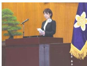
保護者を代表して送られた 水元PTA会長の祝辞