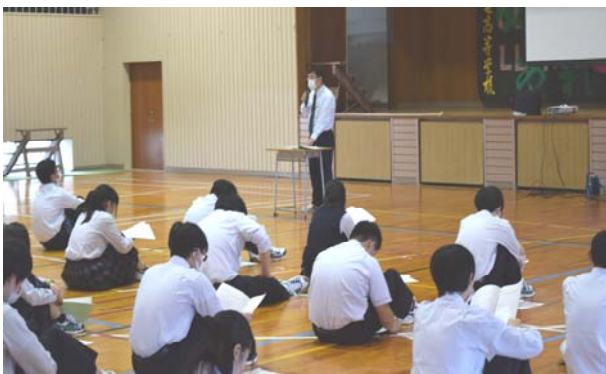
1年生のオリエンテーションの様子(下・右下)

長い休校のトンネルを抜け、ようやく学校が再開されました。 6月1日(月)、新入生は遅ればせながらのオリエンテーションを実施。2・3年生は学年集会を開いて新年度への心構えを確認しました。 生徒たちは皆、久しぶりの学校生活の再開をやや緊張気味ながらも楽しんで受け止めていました。 これからがいよいよ本番です。皆さん頑張ってください。