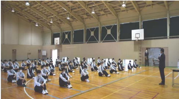
3年生の学年集会で訓話される角校長先生(上)