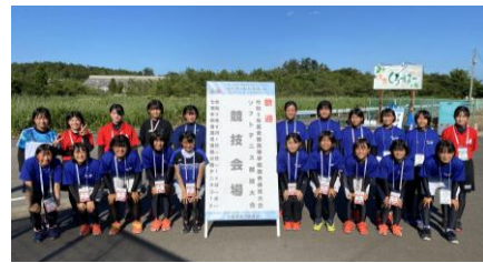
【団体戦を戦ったメンバーたちと女子ソフトテニス部集合写真】