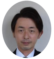
平 武 (地歴公民)