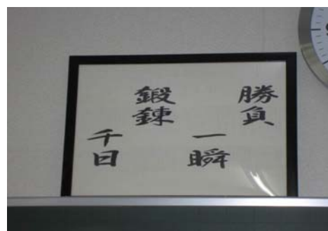
【勝負一瞬 鍛錬千日 の額】

今、その三分の一の節目を迎えようとしています。この千日の間に自らの学力・体力・精神力を研ぎ、鍛え上げ、 来たる勝負の時には最高のパフォーマンスが出来る よう盤石の備えをして下さい。