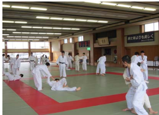
【受け身練習の様子】

います。生徒達には是非、文武の両面において『 高い志と闘う心 』を持って努力を継続し、夢の実現を果たして欲しいと願っています。