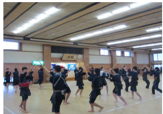
【面と胴の打ち込み練習】

当日はテレビや新聞など多数の報道機関が取材に訪れており、実技の指導にあたった体育科の先生方からは「今年の1年生は積極的に技をかけ、打ち込んでいる」との声を頂きました。